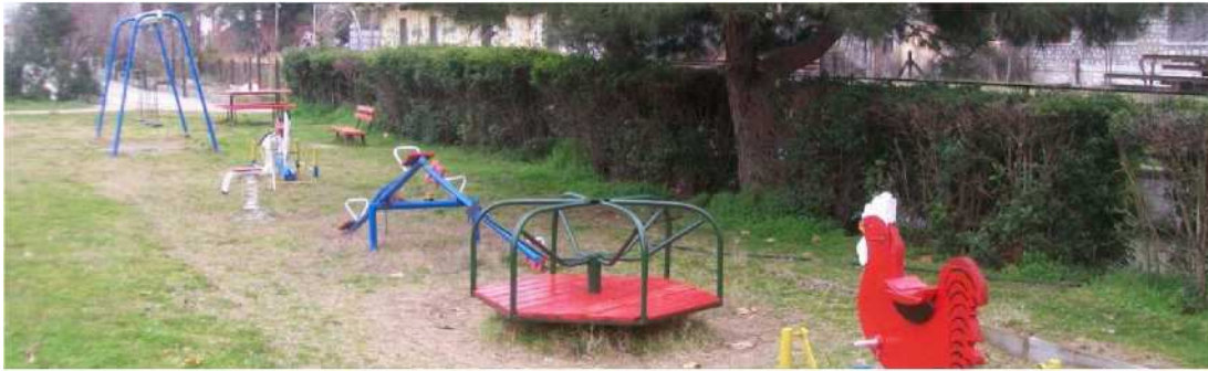
Φωτ. 4: Έλλειψη δαπέδων ασφαλείας